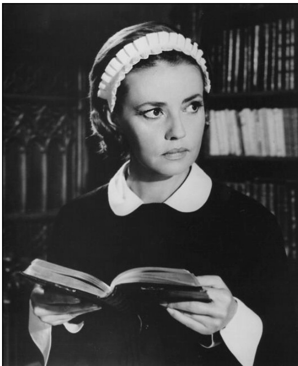
Journal d'une femme de chambre Luis Bunuel, 1964