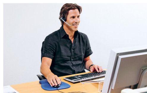
8 Le kit mains libres est un accessoire indispensable pour les utilisateurs fréquemment occupés au téléphone.