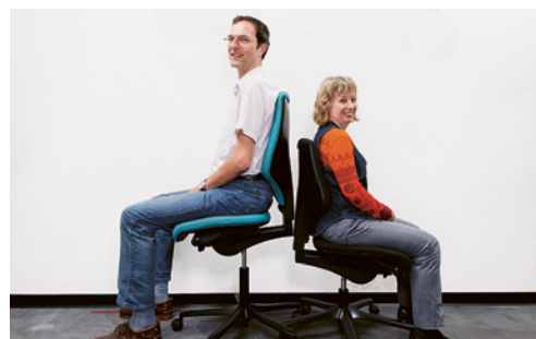
3 Les fauteuils standard sont généralement inadaptés aux personnes de grande taille. De nombreux fabricants proposent des modèles «grande taille».