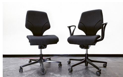
5 Les accoudoirs permettent aux personnes corpulentes ou souffrant de douleurs aux genoux de s'asseoir et de se lever plus facilement, mais n'ont pas d'utilité ergonomique.

Si vous optez pour des accoudoirs, ces derniers doivent être courts et réglables en hauteur ou en profondeur.