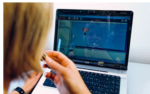
7 Les écrans brillants ne sont pas adaptés car ils produisent des reflets désagréables.