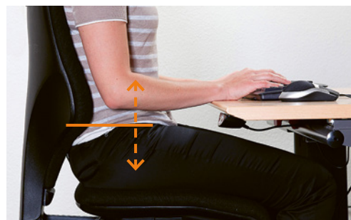
4 Le réglage de la hauteur du dossier permet de positionner correctement le support lombaire.