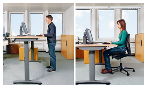
2 Table dotée d'une plage de réglage de 65 à 125 cm convenant aussi bien à une personne de petite taille travaillant assise qu'à une personne de grande taille travaillant debout.