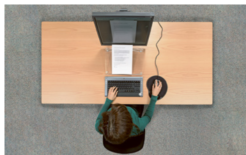
1 Le plan de travail doit avoir une profondeur suffisante pour permettre de placer des documents entre le clavier et l'écran.