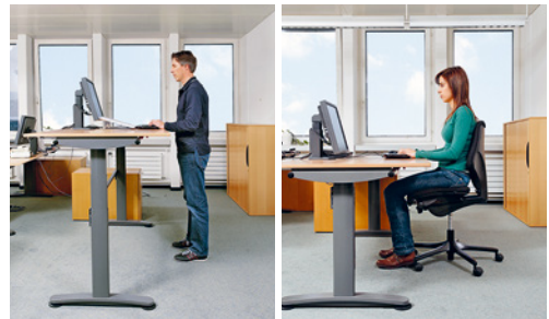
2 Ein Verstellbereich von 65 bis 125 cm gewährleistet, dass am Tisch sowohl kleine Personen sitzend als auch grosse Personen stehend arbeiten können.