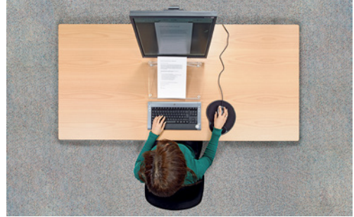
1 Der Bildschirmarbeitsplatz muss eine genügende Tiefe aufweisen, damit Tastatur, Bildschirm und Dokumente hintereinander Platz finden.